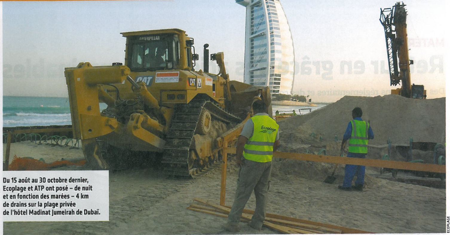
Du 15 août au 30 octobre dernier, Ecoplage et ATP ont posé – de nuit et en fonction des marées – 4 km de drains sur la plage privée de l'hôtel Madinat Jumeirah de Dubaï.